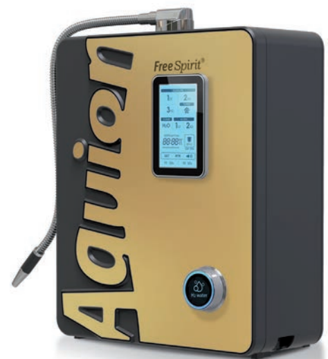
Neues Kapitel einer Erfolgsstory: Der Aquion FreeSpirit

Jetzt kann unser wichtigstes Lebensmittel, das Trinkwasser, gezielt moduliert werden – je nach Bedürfnis und persönlicher Lebenssituation. Dies macht das